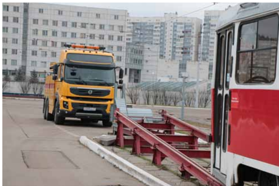
Автомобиль техпомощи и эстакада для погрузки трамвая на эвакуатор