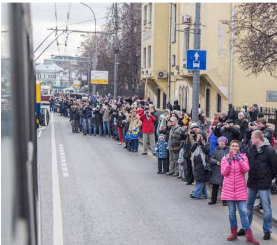
Москвичи наблюдают за парадом ретротехники