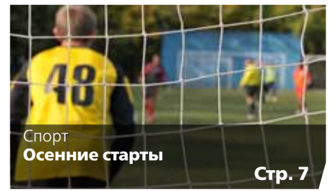
Спорт Осенние старты