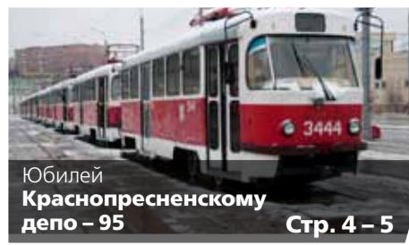
Юбилей Краснопресненскому депо – 95