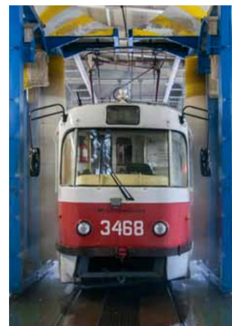
Мойка подвижного состава