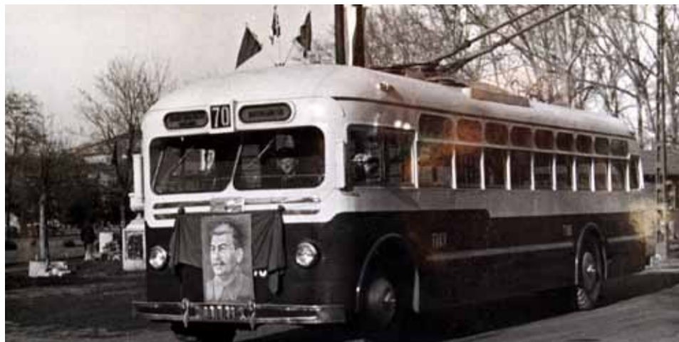
Запуск троллейбуса в Будапеште

«Великая цель требует великой энергии». Анатолий Рыбаков.