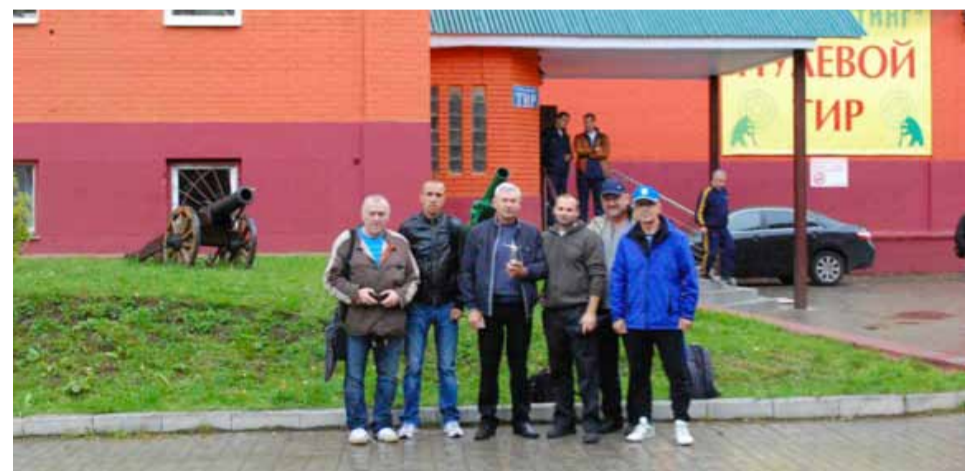
Команда 5-го автобусного парка

«Пулевая стрельба проходит у нас уже третий год, каждый раз соревнования находят живой отклик у участников, количество команд растет с каждым годом, поэтому думаю, что мы и дальше будем проводить этот турнир. Самое главное в любом корпоративном спорте — то, что он объединяет коллег, дает людям общие интересы, сплачивает коллектив и делает