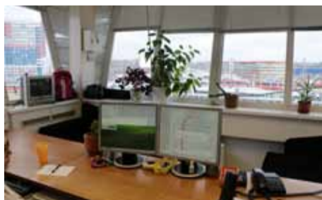
Центр управления стрелочными переводами

транспортной развязки третьего транспортного кольца и снятием трамвайной линии по Беговой улице, сеть Краснопресненского депо оказалась полностью отрезана от остальной трамвайной сети в городе. В настоящее время перевозка трамвайных вагонов из Краснопресненского депо в другие осуществляется с помощью специального автоприцепа. На территории филиала даже оборудована специальная эстакада для погрузки трамвайных вагонов.