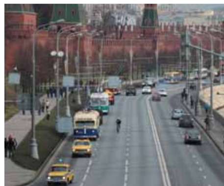
Колонна у стен Кремля