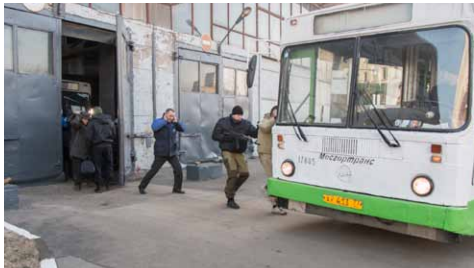
Один из этапов учебной спецоперации

В работе штурмовых групп использовались специальные автомобили «Тигр» и БТРы. Сотрудники спецподразделений полиции десантировались на захваченный объект с полицейского вертолета. Операция завершилась освобождением заложников и арестом злоумышленников, после чего к своим обязанностям приступили пожарные расчеты — для тушения горящего здания ангара, и медики — для оказания скорой медицинской помощи пострадавшим. Для обследования территории на предмет нахождения взрывных устройств были задействованы служебно-розыскные собаки, а когда такое устройство было найдено — к месту прибыла группа ликвидации угрозы взрыва на специальном автомобиле. Сапер в защитном