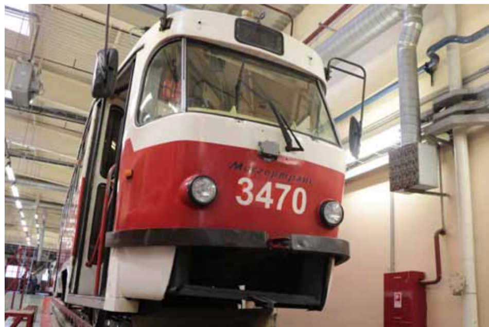
Трамвай Татра в ремзоне